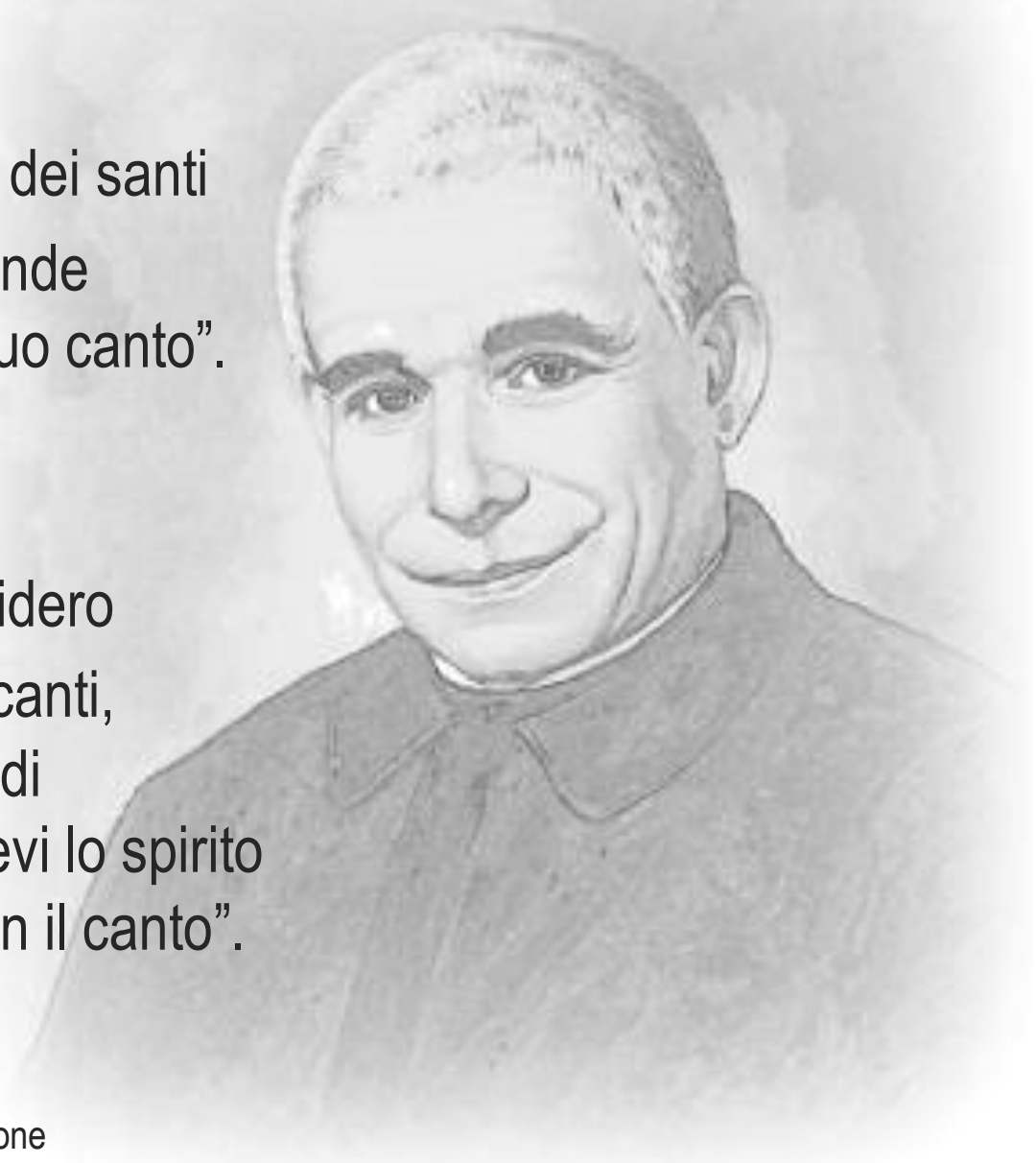
San Luigi Orione

“Io desidero che si canti, che si lodi e si sollevi lo spirito a Dio con il canto”.